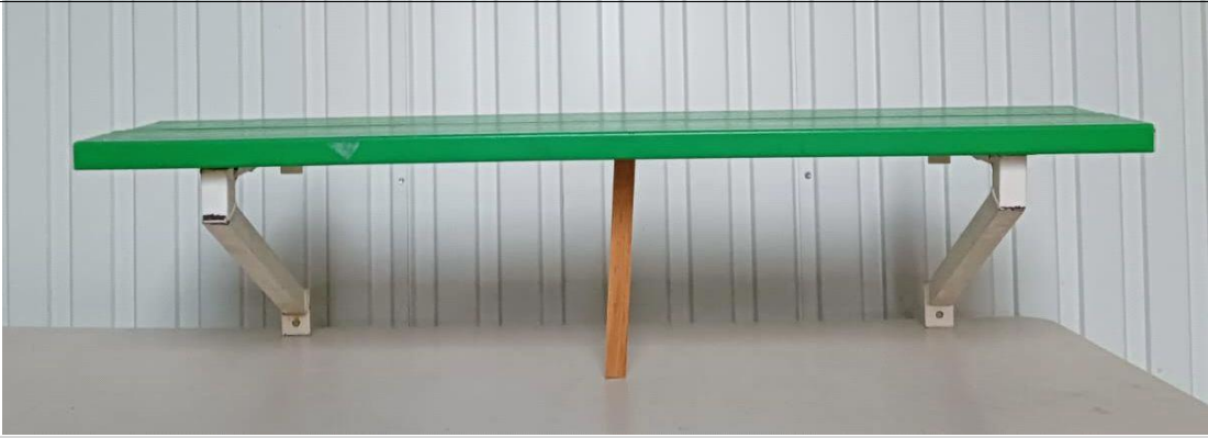
Vue de face banc