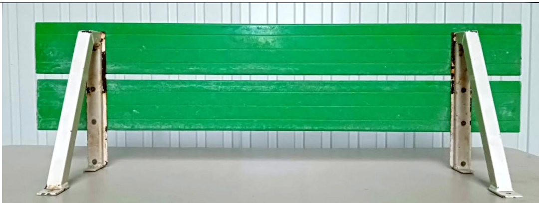
Vue de dessous banc