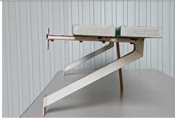
Vue de profil banc